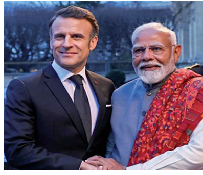
भारत में बनाएंगे। इसे हम पूरे विश्व को एक्सपोर्ट करेंगे। भारत और फ्रांस के

पीएम मोदी ने H-125 हेलीकॉप्टर का किया जिक्र - पीएम मोदी ने एच-125 हेलीकॉप्टर के बारे में बात करते हुए कहा, 'हमें गर्व है कि भारत और फ्रांस मिलकर माउंट एवरेस्ट की ऊंचाई तक उड़ान भरने वाला विश्व का पहला हेलीकॉप्टर