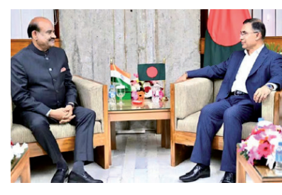
तारिक रहमान को मिला दिल्ली आने का न्योता - लोकसभा अध्यक्ष ने एक्स पर पोस्ट कर कहा, 'बांग्लादेश के प्रधानमंत्री तारिक रहमान के साथ एक सार्थक बैठक संभव हुई। मैंने पीएम मोदी

नई दिल्ली | लोकसभा अध्यक्ष ओम बिरला ने मंगलवार (17 फरवरी) को बांग्लादेश के नव निर्वाचित प्रधानमंत्री तारिक रहमान से मुलाकात की और उन्हें प्रधांमंत्री नरेंद्र मोदी का व्यक्तिगत बधाई पत्र सौंपा। ओम बिरला, विदेश सचिव विक्रम मिसरी के साथ भारत सरकार की ओर से रहमान के शपथ ग्रहण समारोह में शामिल हुए। लोकसभा अध्यक्ष ने मालदीव के राष्ट्रपति, भूटान के प्रधानमंत्री और अन्य नेताओं से भी मुलाकात की।