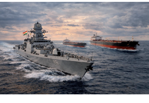
नंबर संयुक्त राज्य अमेरिका द्वारा पहले प्रतिबंधित किए गए जहाजों से मेल खाते थे, ईरान की राष्ट्रीय ईरानी तेल कंपनी (एनआईओसी) ने इन जहाजों से किसी भी तरह के संबंध से इनकार किया। अधिकारियों को संदेह है कि ये जहाज खुले समुद्र

तीनों जहाजों, जिनकी पहचान स्टेकर रूबी, एस्फाल्ट स्टार और अल जाफजिया के रूप में हुई है, ने कथित तौर पर अपनी पहचान छिपाने के लिए अपने नाम और झंडे बदल लिए थे। हालांकि उनके आईएमओ