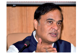
अपने दौरे के दौरान तीखी टिप्पणी की।